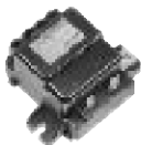
すばやく確実に点火させる スパークユニット