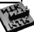
放電加工が可能な 導電性ジルコニア製材